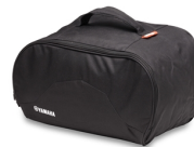
Innentasche für Topcase City, 39l