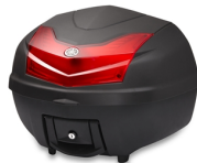
Topcase City, 39l