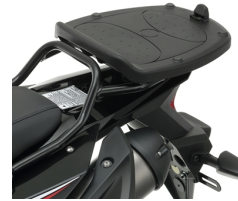
Montageplatte für Topcase City, 30L